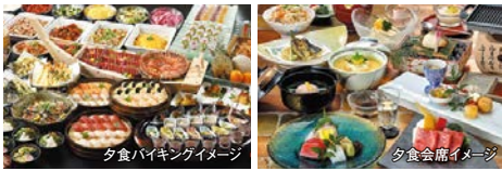
夕食バイキングイメージ

バイキングやその他、地域の名産や豪華食材が食べ放題のプレミアムバイキングや会席料理など、多彩なお料理でお客をお迎えいたします。