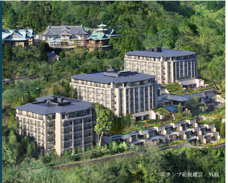
エクシブ箱根離宮 / 外観

全国 21 カ所のホテルを、1 年を通してご利用になれます。ぜひご家族や大切な方とリゾート旅行をお楽しみください。